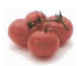
Tomate cerise hybride

L'Institut de l'Environnement et de Recherche Agricoles (INERA) a mis au point 3 nouvelles variétés de tomates à savoir FBT1 ; FBT2 ; FBT3. Ces variétés sont non seulement adaptées à la saison pluvieuse, mais offrent également une bonne aptitude à la transformation et à la conservation. Ces variétés sont un peu plus grosses comparativement aux tomates cerise qui sont de petites tailles. Elles sont également fermes, moins juteuses et bien charnues. A l'AVOH nous utilisons les tomates cerise hybride et les nouvelles variétés de l'INERA.