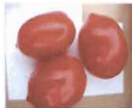
Tomates variétés INERA