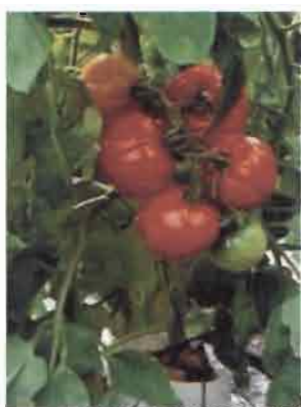
Tomates fraîches sur pied

Les tomates fraîches utilisées pour le séchage proviennent des jardiniers de la ville de Bobo et des villages environnants. Les tomates ont été acquises auprès des vendeurs grossistes des marchés de la ville de Bobo-Dioulasso.