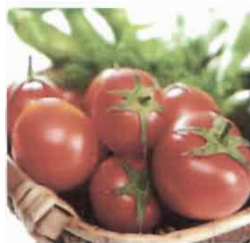
Tomates fraîches cueillies